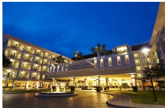
チェンマイ・カンタリーヒルズホテル