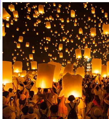
イーペンサンサーイ祭り