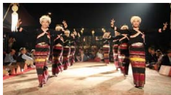
カントークディナーショー