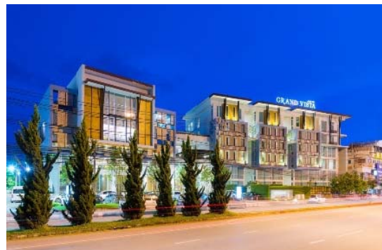
チェンライ・グランドビスタホテル