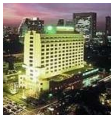
エバーグリーンローレル