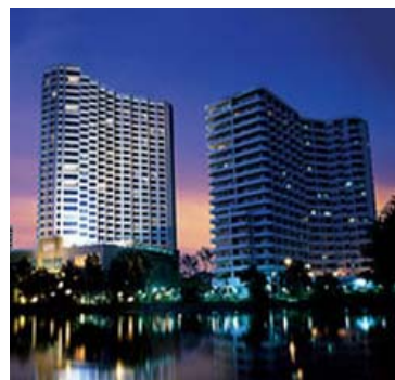
ホリデイ・イン・チェンマイ