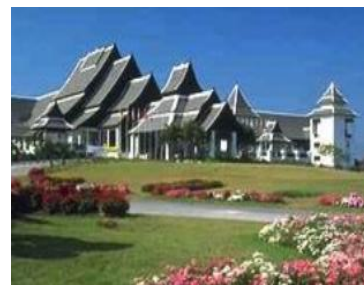
リムコックリゾートホテル